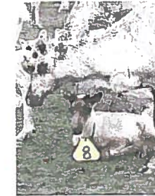
Vasa on saanut lukkurin eli numerolapun kaulaansa.

määrät ovat kasvanet räjähdysmäisesti, mikä on ongelma poronhoidolle.